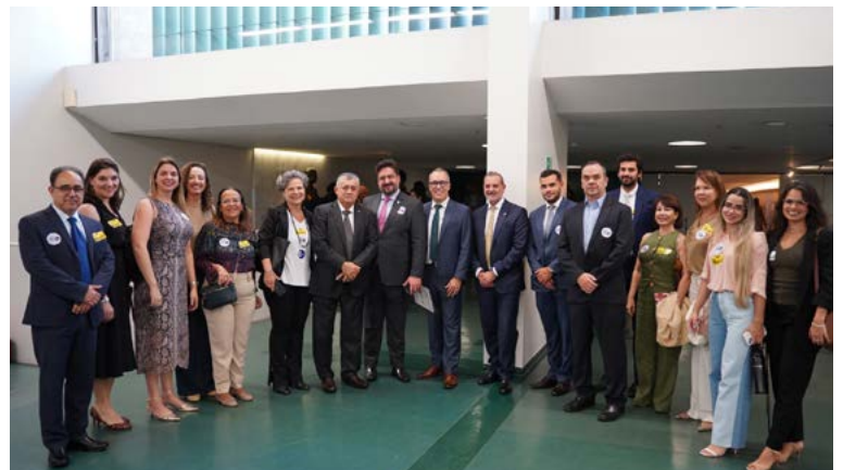
7 de maio de 2025: Delegação paulista com o Líder do Governo, José Guimarães (PT-CE), durante mobilização pela Autonomia da Advocacia Pública.

Em um novo dia histórico, 7 de maio de 2025, centenas de Advogados Públicos federais, estaduais e municipais lotaram os corredores, gabinetes e salas de comissões da Câmara dos Deputados e do Senado Federal para defender a PEC 17/2024 e a causa da autonomia administrativa, técnica e orçamentária para a Advocacia Pública Nacional.