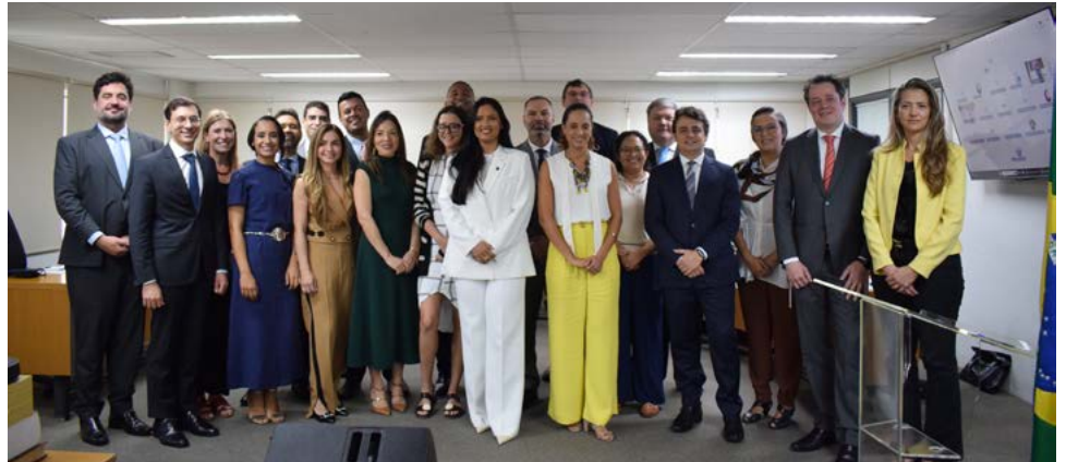
Sessão solene de posse dos novos Procuradores e Procuradoras de SP.

“Vocês ingressam hoje em uma carreira que ocupa um lugar absolutamente estratégico no Estado brasileiro. A advocacia