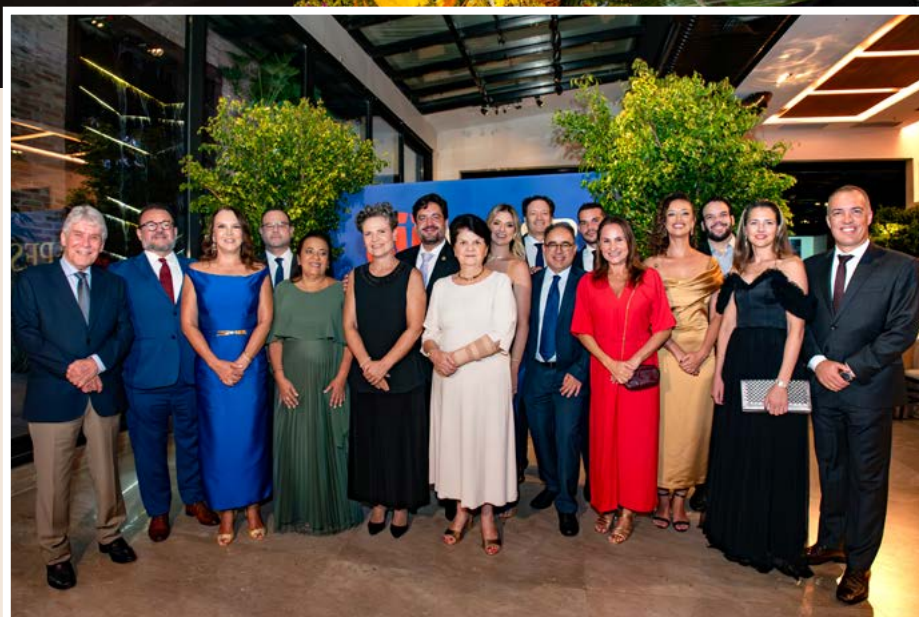
Integrantes da nova composição da Diretoria da APESP na festa de posse no Villa Vérico.

A Procuradora Geral do Estado de São Paulo, Inês Coimbra, parabenizou os integrantes da nova gestão da Associação. "O trabalho da APESP tem sido essencial para a melhoria da nossa instituição. É uma atuação séria, comprometida e pautada pela lealdade aos colegas, que tem contribuído muito para os avanços que temos conquistado. Queria dizer que são tempos de luta, mas que estaremos juntos para construir uma PGE melhor".