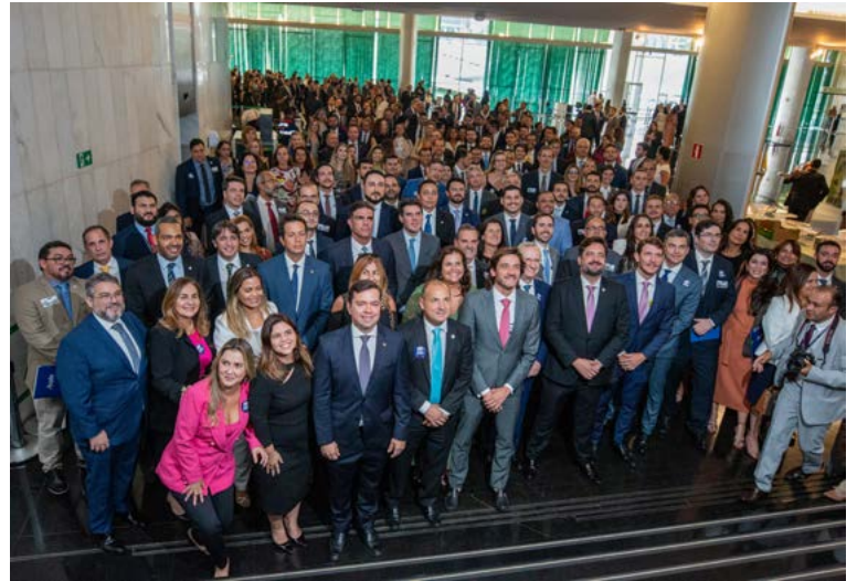
14 de maio de 2024: Mais de 400 Advogados Públicos lotaram o Salão Negro do Congresso Nacional um dia após a apresentação da PEC 17.

“Demos uma incrível demonstração de união e força. Em um dia inesquecível, foi possível vislumbrar uma Advocacia Pública