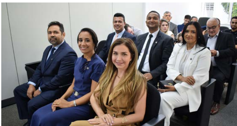
Novos colegas que ingressaram na PGE-SP.