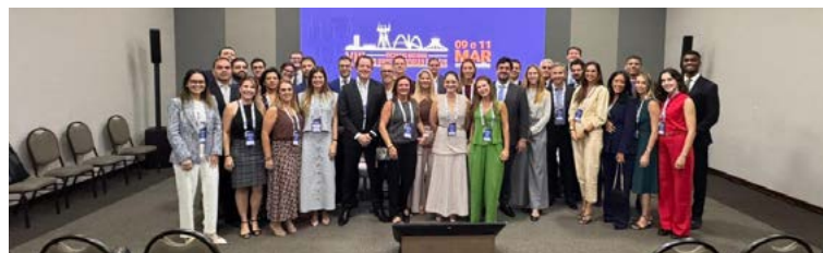
Delegação paulista no 13º ENPF, realizado em Brasília.

A Diretoria da APESP participou do 13º Encontro Nacional das Procuradorias Fiscais, que ocorreu em Brasília, entre os dias 9 e 11 de março, com o tema “Advocacia Pública Fiscal: Federalismo de Cooperação e Inovações Jurídicas – uma realização da ANAPE e da APDF. O evento teve em sua programação oficinas, palestras, apresentação de trabalhos (papers) e reuniões de fóruns setoriais como o CONPEG, o FONACON, CONAP, FONACE, FONACASC e de Corregedores Gerais. A delegação paulista contou com cerca de 50 Procuradores e Procuradoras do Estado.