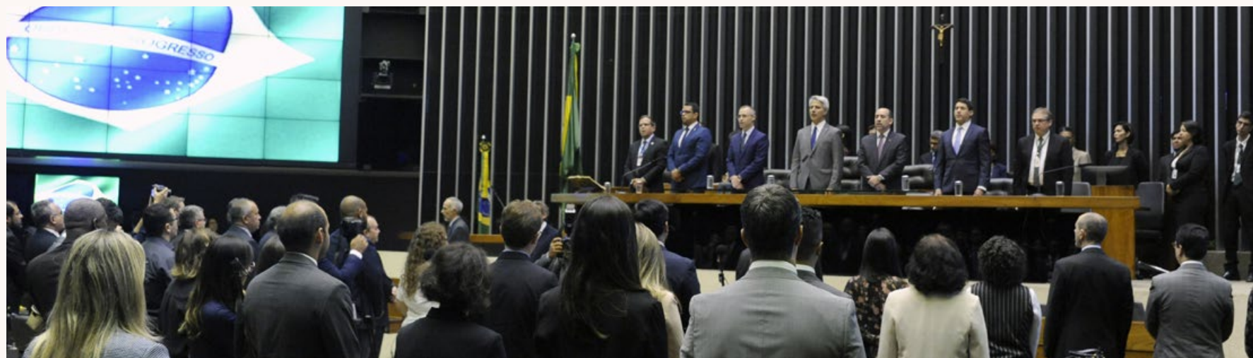
21 de março - Solenidade em homenagem ao Dia Nacional da Advocacia Pública.