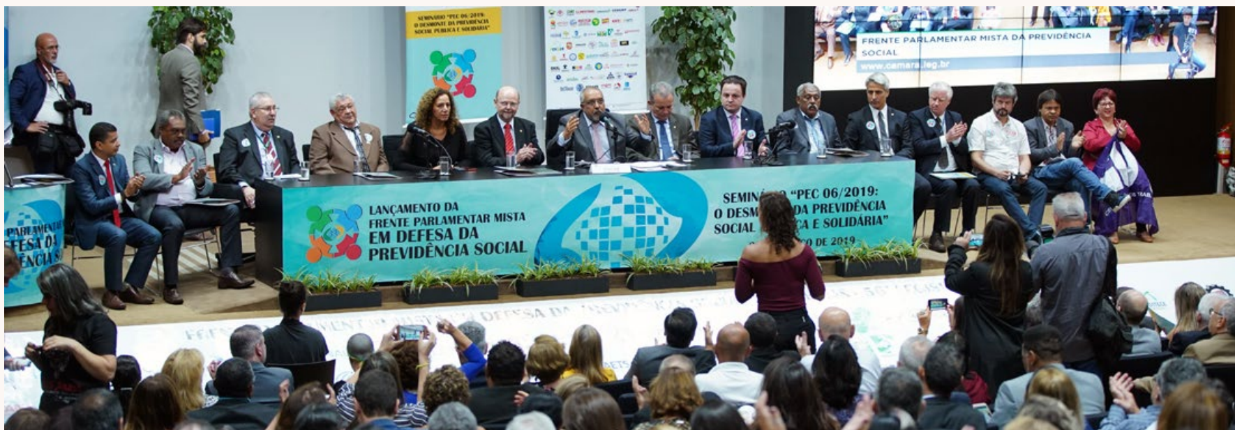
20 de março - lançamento da Frente Parlamentar Mista em Defesa da Previdência Social.