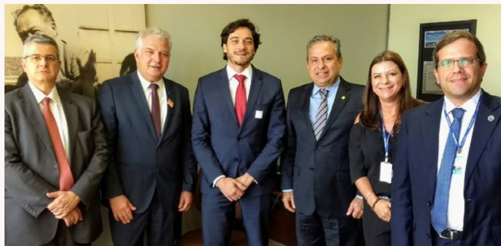
20 de fevereiro - Reunião com o Deputado Tadeu Alencar (PSB-PE).