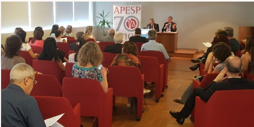
22 de fevereiro - Reunião aberta para tratar da Reforma da Previdência.