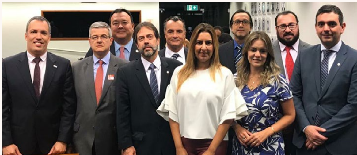
13 de fevereiro - Audiência sobre a PEC 6 na Câmara dos Deputados.

A atividade de coleta de assinaturas nas emendas continua até o momento. “Até agora, percebemos uma grande dificuldade na coleta dessas assinaturas, mas estamos trabalhando com afinco e, se Deus quiser, vamos conseguir!”, ponderou Nusdeo. As emendas apresentadas tratam dos seguintes assuntos: 1) exclusão da possibilidade de desconstitucionalização das regras da Previdência hoje previstas na Constituição Federal; 2) supressão da regra que prevê a segregação contábil do orçamento da seguridade social; 3) melhora nas regras da aposentadoria por invalidez; 4) melhora nas regras de pensão por morte e acúmulo de benefícios; 5) supressão do regime de capitalização; 6) melhora nas regras do abono permanência; 7) supressão da regra prevista no § 3º, do artigo 42, na redação dada pela PEC; 8) supressão da possibilidade de instituição de alíquotas progressivas e alíquotas extraordinárias no âmbito do RPPS; 9) inclusão de regra de transição para todos os servidores; 10) instituição de possibilidade de migração para o Regime de Previdência Complementar, pelo prazo de seis (6) meses, para os atuais servidores.