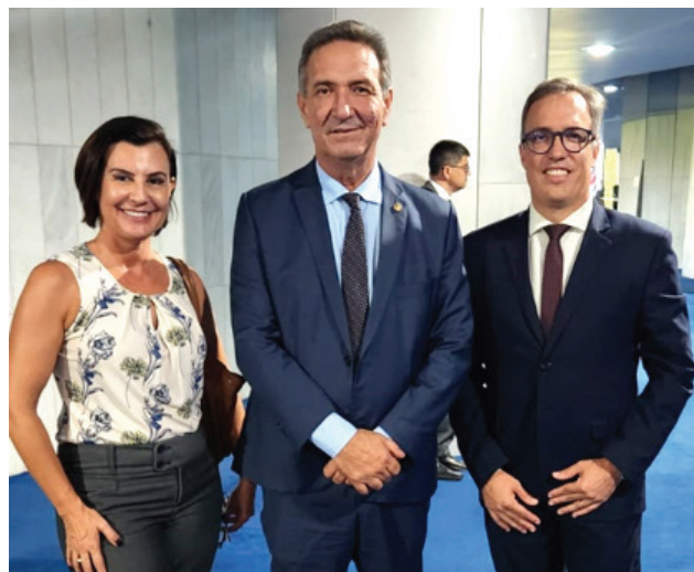
Diretor da APESP com o Senador Lucas Barreto

A emenda foi acolhida no relatório do Senador Weverton (PDT-MA), na Comissão de Constituição e Justiça, e mantida no texto aprovado