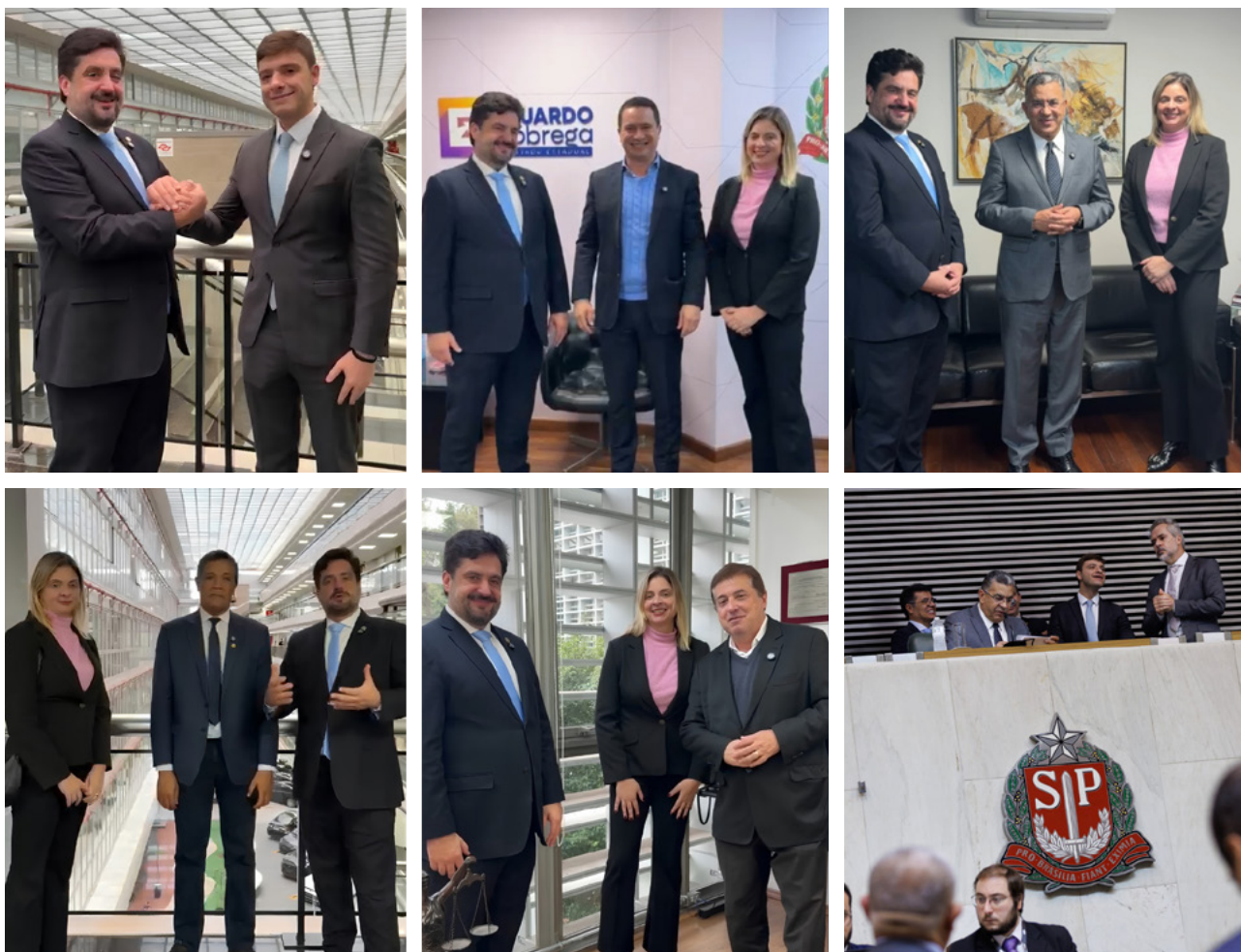
No sentido horário: Dirigentes da APESP com os Deputados Thiago Auricchio; Eduardo Nobrega; Gilmaci Santos; Reis; e Jorge Caruso.

A Assembleia Legislativa do Estado de São Paulo aprovou, em 19 de maio, em votação simbólica, o PL 418/2026, que amplia de 5 para 20 dias a licença-paternidade dos servidores públicos estaduais. O projeto aprimora ainda as regras atuais da licença-maternidade para que o benefício passe a contar após a alta hospitalar da mãe ou do bebê (o que ocorrer por último).