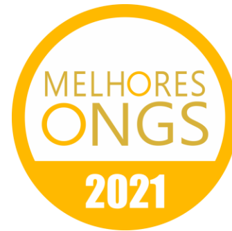
Prêmio Melhores ONGs