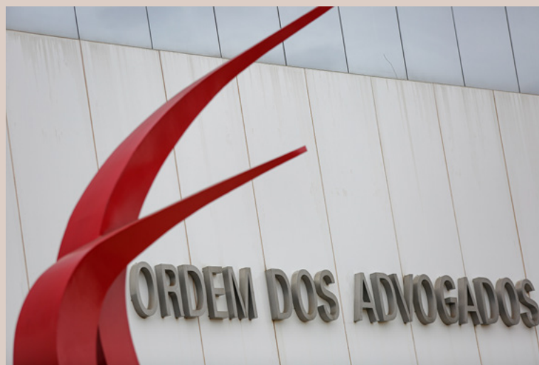
Prédio da OAB Nacional em Brasília.

O voto inicial foi do Ministro Cristiano Zanin pela inconstitucionalidade, sendo acompanhado pelos Ministros Flávio Dino, Alexandre de Moraes, Luís Roberto Barroso e Gilmar Mendes.