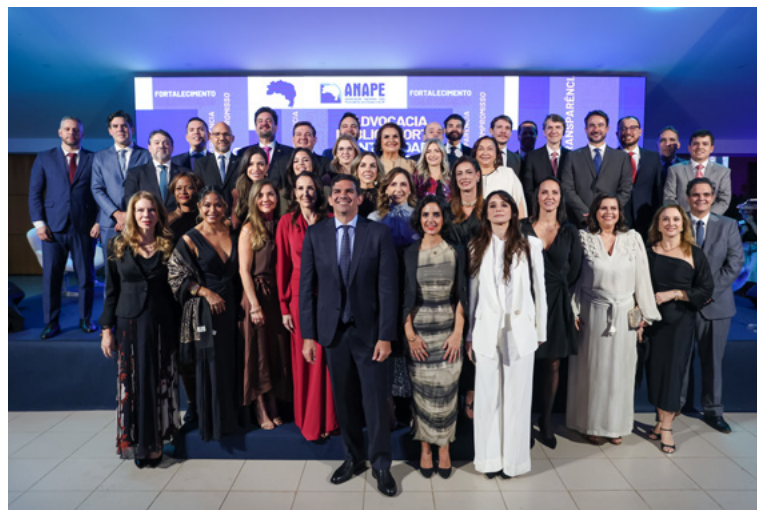
Nova Diretoria da ANAPE para o triênio 2026-2029.