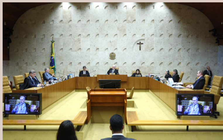
Sessão do STF de 30 de abril que definiu a obrigatoriedade da inscrição dos Advogados Públicos na OAB.