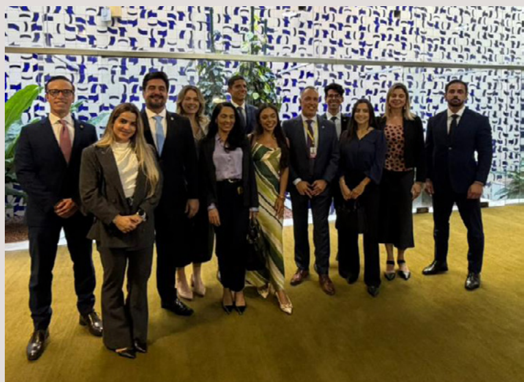
Mais momentos da delegação paulista na mobilização pela autonomia.