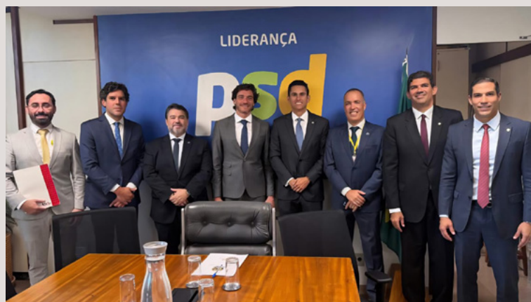
Encontro com o Deputado Domingos Neto.