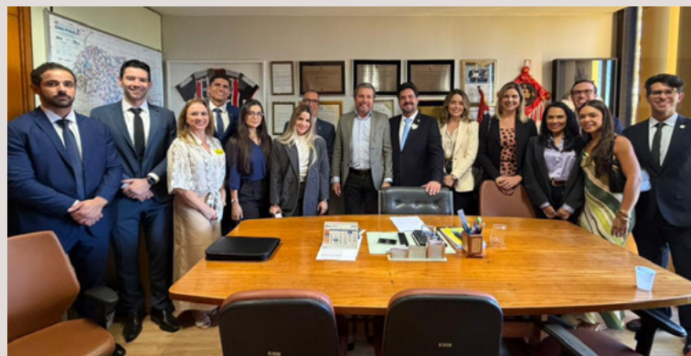
Reunião com o Deputado Fausto Pinato.