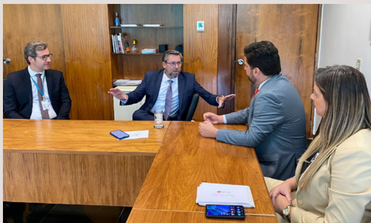
Reunião com o Deputado Carlos Sampaio, autor da PEC 17/2024.