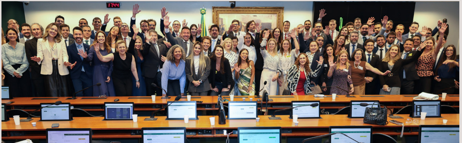
Centenas de Advogados Públicos lotaram o Congresso Nacional pela Autonomia das PGEs.

Pelo terceiro ano consecutivo, no mês de maio, foi realizado o "Dia de Mobilização em Defesa da Autonomia da Advocacia Pública"