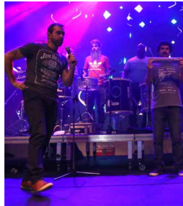
Show da Banda Jota Quest na festa de fim de ano da APESP!