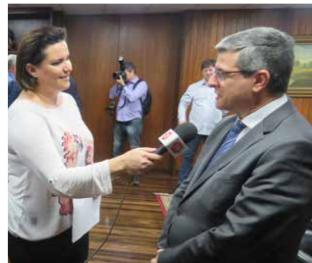
O Presidente Nusdeo concedeu entrevista para a TV ALESP.