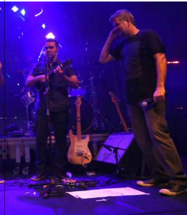
Apresentação da Banda Du Rio!

A MELHOR FESTA dos últimos tempos! Esse foi o sentimento expressado pelos 750 convidados da festa de fim de ano APESP, realizada no Clube Monte Líbano, na noite de 26 de novembro. Após um delicioso jantar, a principal atração da noite, a banda Jota Quest, tocou seus grandes sucessos (“Fácil”, “Encontrar Alguém”, “Amor Maior”, “Além do Horizonte” etc) para uma plateia lotada e muito animada. Logo após, a Banda Du Rio apresentou um repertório de samba, pop, rock, frevo, xote e funk carioca, não deixando a agitação diminuir. Quando os shows terminaram, a festa não parou! Ao som do DJ, a diversão continuou noite adentro na pista de dança.