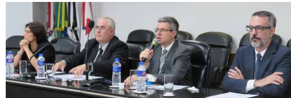
Painel “O Advogado Público e a Previdência Social: regime jurídico, direitos e perspectivas”.

de contagem de tempo de contribuição fictício (art. 40, parágrafo 10º da CF); foi eliminada a possibilidade de não haver contribuição previdenciária específica para aposentadoria, bem como já fixado seu percentual mínimo (art. 149, parágrafo 1º da CF); estabeleceu-se idade mínima para a aposentadoria, compatível com as características do serviço público, eliminando aposentadorias precoces (art. 40, parágrafo 1º, inciso III, alíneas “a” e “b” da CF); ficou estabelecido, como regra geral, que o valor dos proventos deve corresponder à média das remunerações utilizadas como base para as contribuições do servidor, seja no RPPS, seja no RGPS (art. 40, parágrafo 3º da CF); reduziu-se o valor da pensão por morte (art. 40, parágrafo 7º da CF); ficou vedada, como regra geral, a paridade remuneratória entre servidores ativos e aposentados, o que impedirá, como regra geral, que, no futuro, aumentos concedidos aos servidores em atividade sejam repassados aos aposentados (art. 40, parágrafo 8º da CF); por fim, houve a fixação de um limite máximo remuneratório sobre a totalidade dos vencimentos/proventos dos servidores (art. 37, inciso XI da CF). Nusdeo explicou que as Emendas Constitucionais 41/2003 e 47/2005 mantiveram, apenas para duas situações específicas, regras de transição que concedem a paridade remuneratória entre servidores ativos e inativos e a integralidade dos proventos, situações bastante justificáveis.